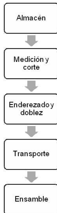
Diagrama de flujo del proceso de trabajo de armado del emparrillado Obra de construcción, ciudad de México, 2017