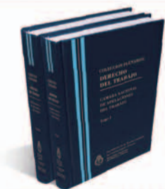
DERECHO DEL TRABAJO