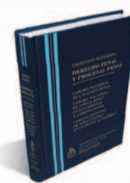
DERECHO PENAL Y PROCESAL PENAL